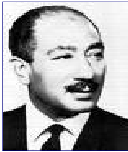
Anouar el-Sadate Président d'Égypte de 1970 à 1981

En partant du nom du prix Nobel de la paix 1978 , prix conjointement reçu avec le premier ministre israélien Menahem Begin , pour les « accords de Camp David », trouvez les mots qui sont définis comme suit :